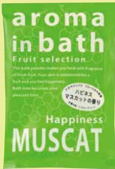
マスカット(グリーン)