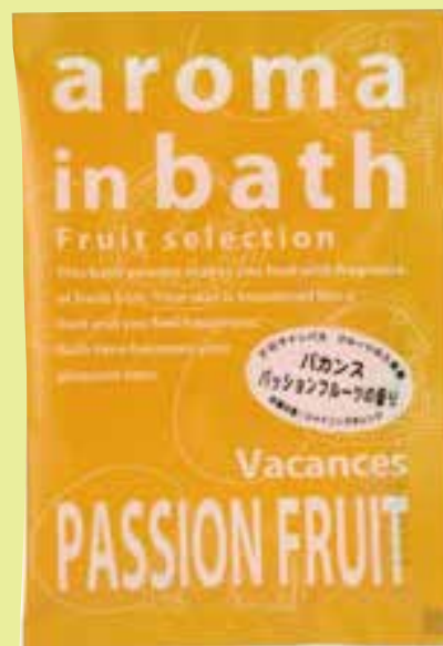
パッションフルーツ(オレンジ)